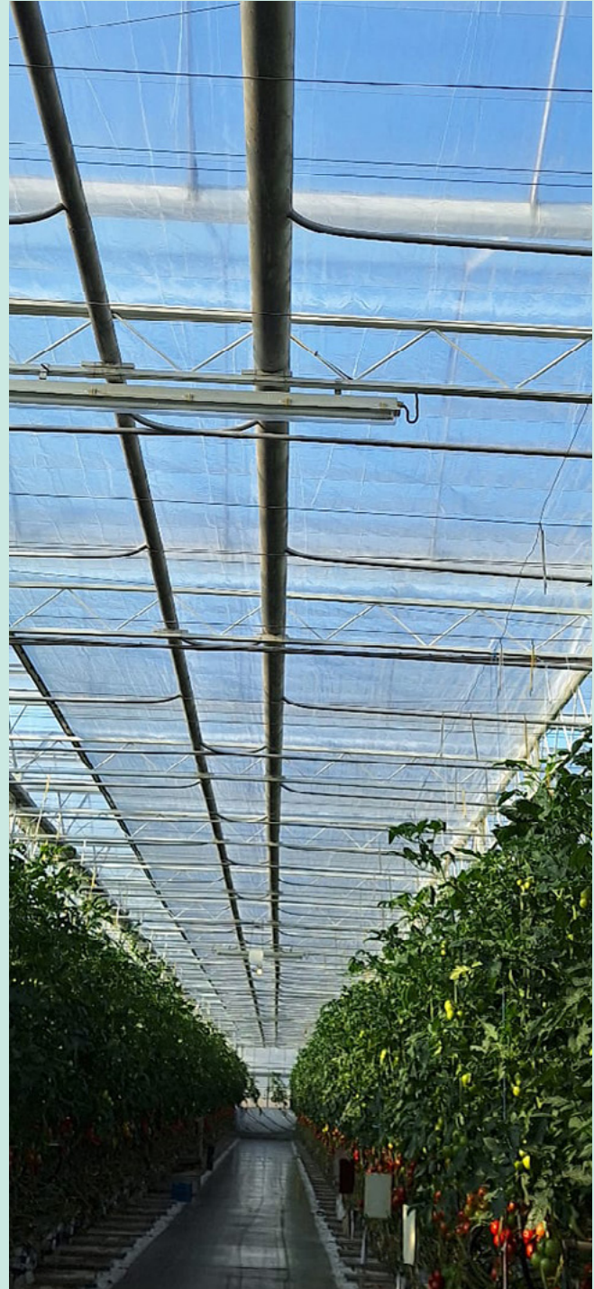
Hermetic Clear - Tomatenkwekerij Jos Pijl

Schermen met een lage permeabiliteit kenmerken zich door een non-poreuze structuur. Dat is een belangrijk verschil met de meeste andere schermen, die wel een poreuze structuur hebben. Poreus betekent dat deze schermen een enorme hoeveelheid microscopisch kleine gaatjes bevatten die op een natuurlijke maar ongecontroleerde manier lucht en vocht doorlaten. De poreuze structuur wordt gecreëerd door het incorporeren van garens in het scherm. Door de garens uit de schermstructuur weg te nemen ontstaat een hermetisch scherm.